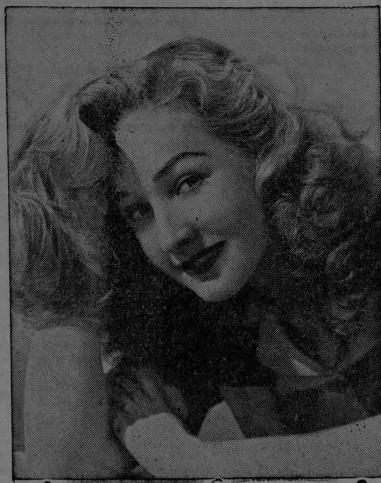
A pesar de su eventud, BONITA GRANVILLE ofrece un perfecto ejemplo de glamor extraordinario

que nace de su porte declara el experto de Hollywood en belleza femenina Max Factor Jr.