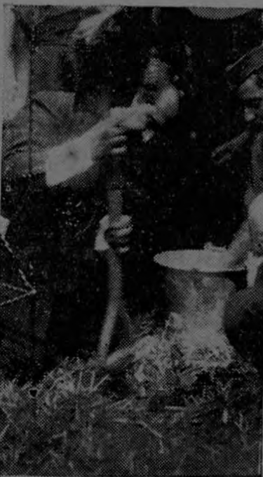
Don José Figueres, pala en mano, apelmazando la tierra después de haber sembrado el simbólico arbolito.

Mañana, cuando la nueva generación se cobije bajo las ramas del Samán de Güere de Bolívar, recordará también la hazaña de Figueres convalentes muchachos, cuya sombra, como la del Libertador, vidente de Casacoima, "crecerá como la sombra cuando el sol declina"... porque palabras nos faltan, para tributarle al Comandante sin ga-